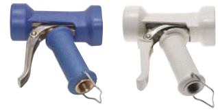
Typ WSP 12